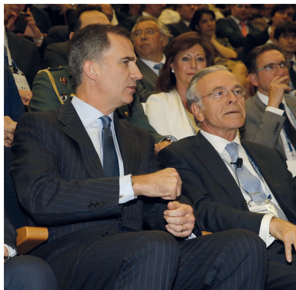
S.M. El Rey Felipe e Isidre Fainé, presidente de CEDE

Los jóvenes son conscientes también de la presión a la que estarán sometidos —lo están ya— para actualizar, potenciar y pulir permanentemente sus conocimientos; lo son también del valor de las experiencias empresariales anteriores y de la importancia de aprender, tanto de los aciertos, como de los errores previos. Saben que para reforzar su empleabilidad habrán de demostrar que son